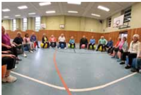
Sportgruppe Dienstag Ratsgymnasium