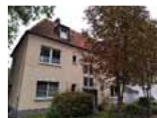
Praxis GE Buer-Hassel