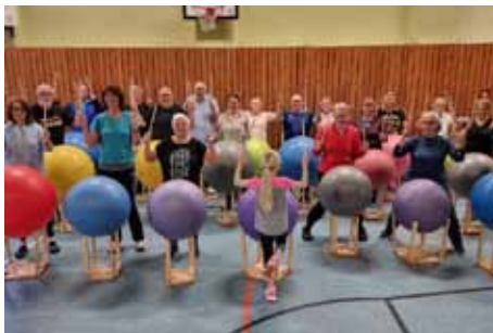
Sportgruppe Dienstag Ratsgymnasium