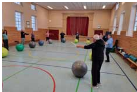
Sportgruppe Donnerstag Pestalozzischule