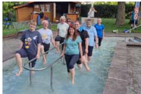
Sportgruppe Donnerstag im Kneipp Garten